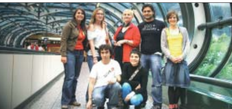
Delegación española en una pasada edición del PLE celebrada en Italia